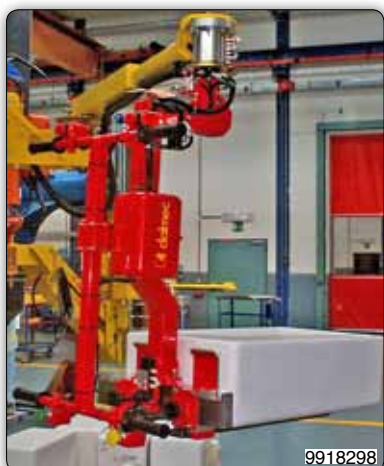
Манипулятор с приспособлением с регулируемыми вилами для перемещения моек.