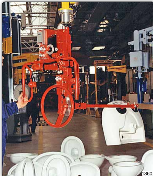
Манипулятор с приспособлением со взаимозаменяемыми присосами для захвата и перемещения сантехнических изделий с устройством ручного поворота.