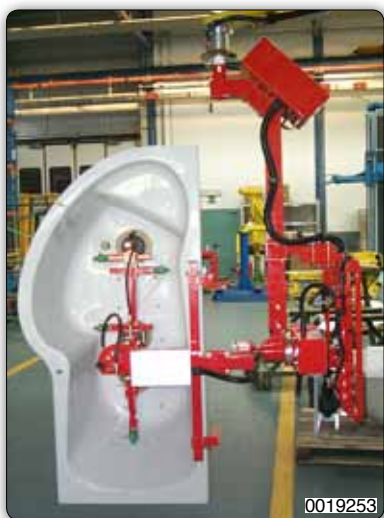
Манипулятор с приспособлением с присосами (Venturi) для захвата и поворота ванн.