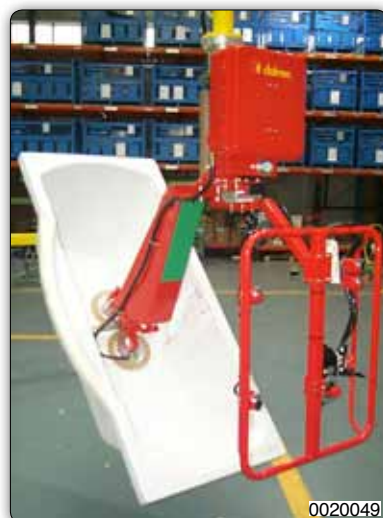
Манипулятор с приспособлением с присосами (Venturi) для захвата и поворота ванн.