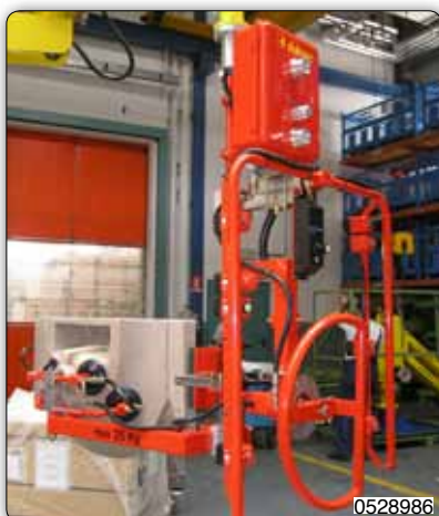
Манипулятор с приспособлением с присосами (Venturi) для захвата и ручного поворота моек.