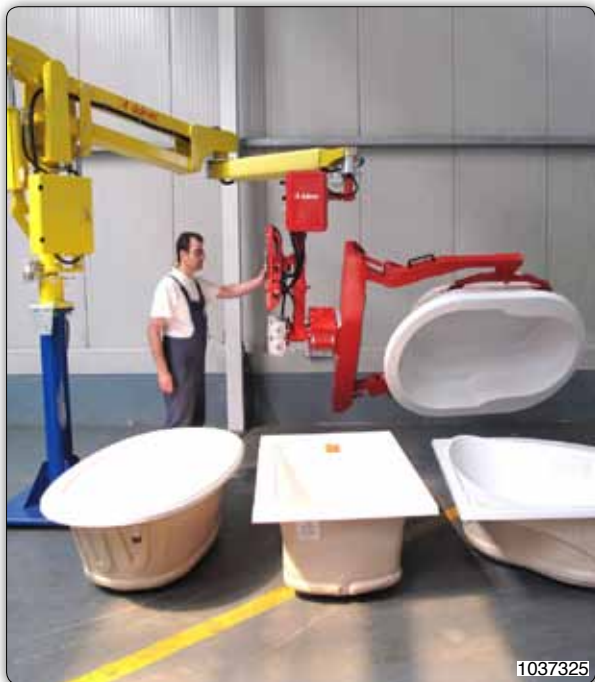
Манипулятор с приспособлением с присосами (Venturi) для захвата и порота ванн.