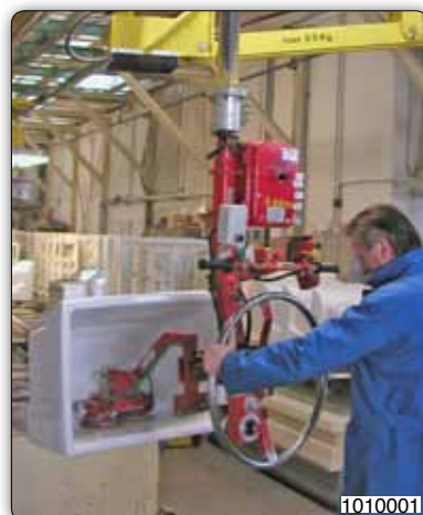
Манипулятор с приспособлением с присосами (Venturi) для захвата и вращения моек.