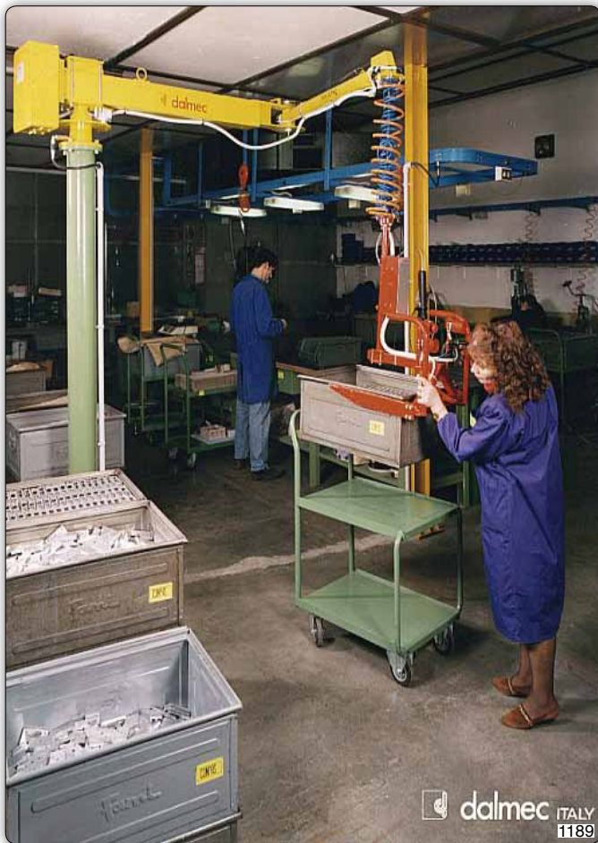
Манипулятор Fosfil типа PFC в исполнении на стойке, оборудованный вилчатым захватом для перемещения ящиков.