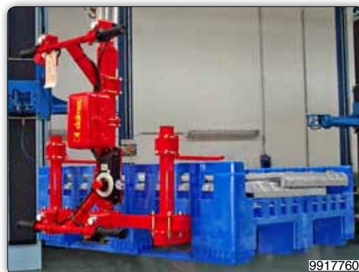
Манипулятор с вилчатым захватом, предназначенный для перемещения пластмассовых ящиков.