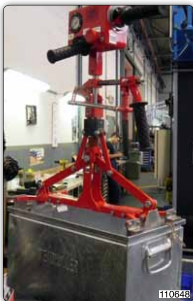
Манипулятор с ножничным приспособлением для захвата и перемещения металлических корзин.