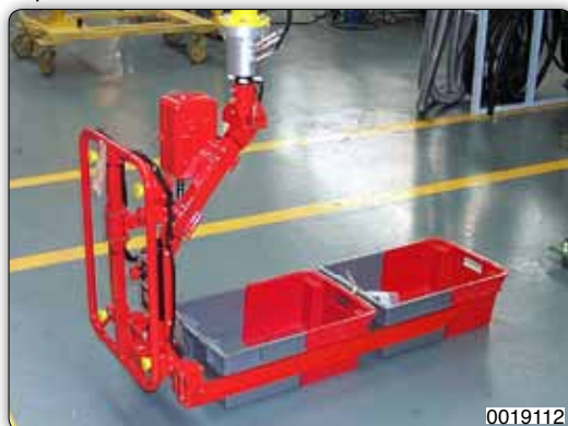
Манипулятор с вильчатым захватом для перемещения ящиков.