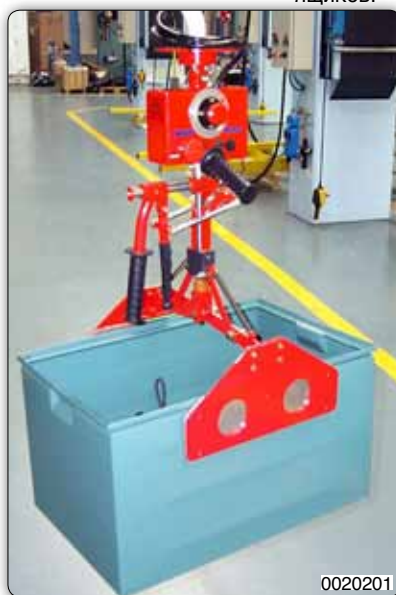
Манипулятор с ножничным приспособлением для захвата и перемещения ящиков.