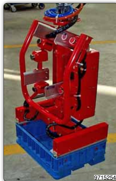
Манипулятор с зажимным приспособлением для захвата ящиков за верхние кромки боковин.