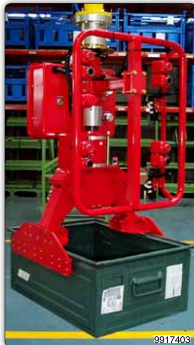
Манипулятор с пневматическим приспособлением для захвата и поворота ящиков.