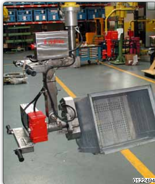
Манипулятор со специальными оборудованный зажимным приспособлением из нержавеющей стали для захвата ящиков.